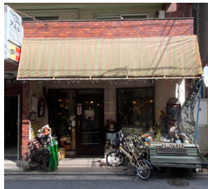
〒160-0022 東京都新宿区新宿 5丁目 10-8 定休日 / 日曜日

新宿御苑にある「アルル」は、御苑から少し離れた小さな商店街の一角に店を構えている。新宿御苑周辺の華やかさや騒々しさからはちよつと距離を置いた、閑静な雰囲気にある昔ながらの喫茶店。店内は広々としており、落ち着ける雰囲気。アンティークなインテリアや机などからは、昭和を思い出させるなつかしさがある。お店の看板猫である次郎長と石松がお出迎えしてくれる。